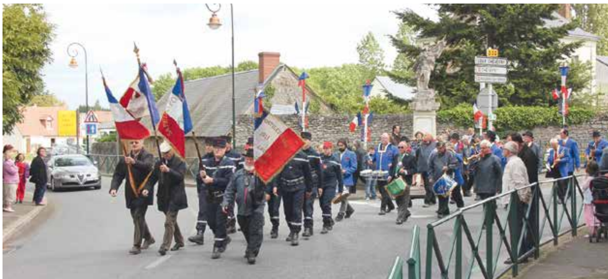
Défilé du 8 mai 2014. Merci aux sapeurs pompiers et à la Pontilevienne.